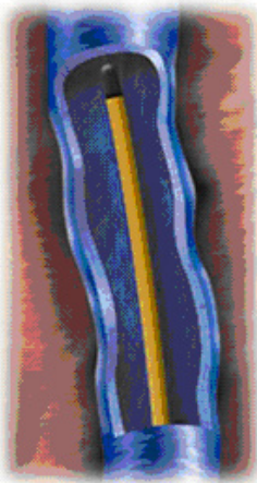
Katheter wordt geplaatst in de ader